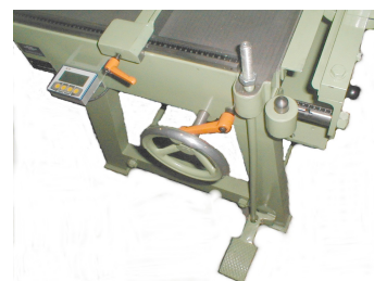
Affichage numérique pour Butée avant et Coupeuse de bandes